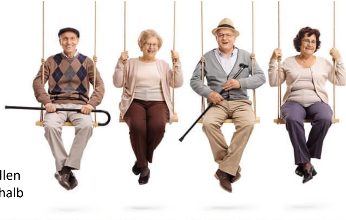
Abb.3: Senioren, o.J.