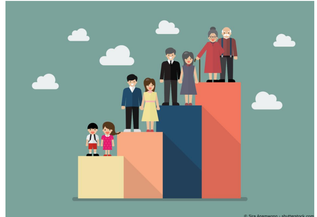
Abb. 6: Demografischer Wandel, o.J.