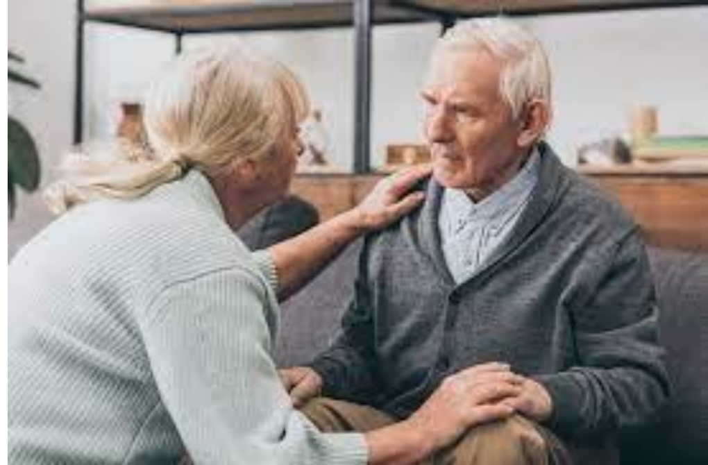
Abb. 4: Hogrefe, 2021