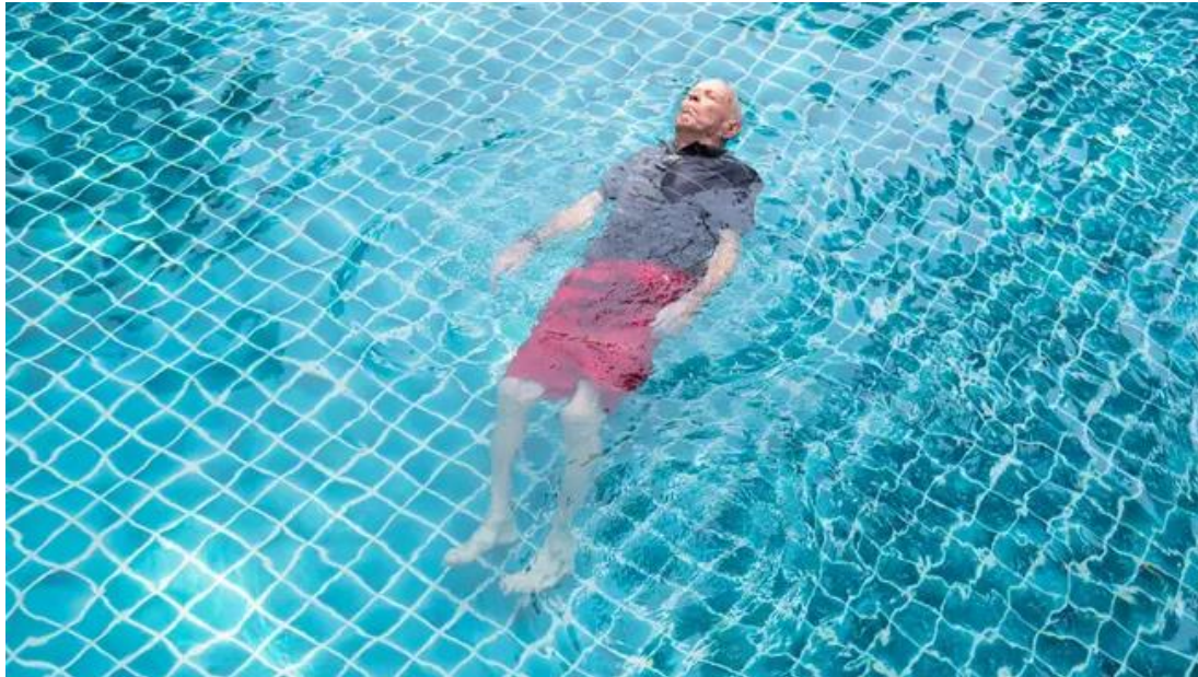
Abb. 5: NZZ, 2015