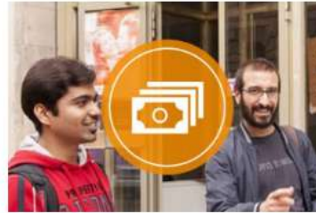
BAföG & Finanzierung.