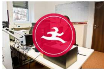
Jobs & Trainings.