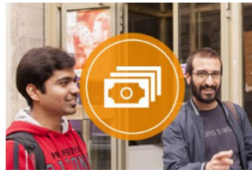
BAföG & Finanzierung.