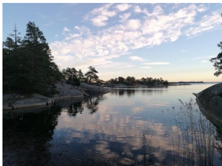
Schwedens einmalige Natur

Als Graduierte ins Ausland zu gehen, erfordert viel Planung und Investition. Gleichzeitig ermöglichen Lebens- und Berufserfahrung ein gewisses Standing, welches für selbstbewusste Entscheidungen und Außenwahrnehmung von Vorteil sein können. Sich selbst in einem anderen Kontext wahrzunehmen, erlaubt unheimlich viel Raum für (Selbst)-Reflexion, welche in der Fülle des alltäglichen und beruflichen Handelns „zu Hause“ oft so kurz kommt. Der Perspektivwechsel hat mir außerdem ein tieferes Verständnis für das Erleben von Fremde gegeben. Wie geht es wohl erst anderen Menschen, die ihre Heimat unfreiwillig verlassen müssen? Tatsächlich bin