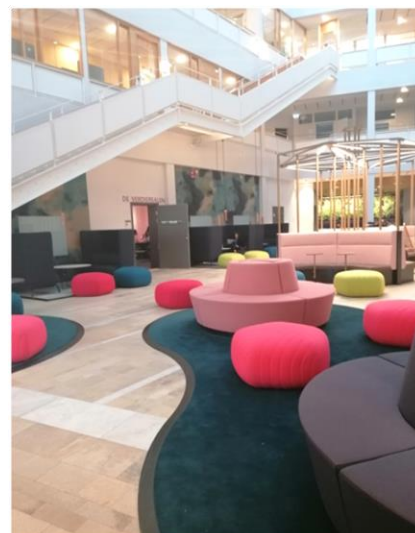
Lernareal am Karolinska Institutet Campus Flemingsberg

TIPP: Werde dir bereits vorab über deine Kompetenzen bewusst, um diese gezielt einzubringen, damit auch die Austauschinstitution einen Gewinn erleben kann. Gleichzeitig bleibe offen und flexibel, neue Kompetenzen dazuzugewinnen. Vermeide ständige Länder-Vergleiche und lenke den Fokus auf neue Möglichkeiten. Versuche in Unterschieden, Anreize für Veränderungspotenziale zu erkennen. Entdecke deine Resilienz, denn Fremde löst Veränderungen aus.