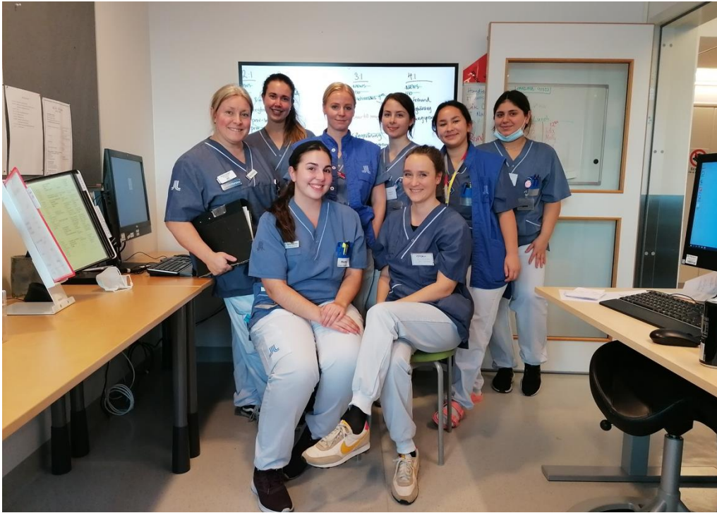
MIT EINEM GRADUIERTENSTIPENDIUM INS AUSLAND

„Die interprofessionelle Zusammenarbeit im Gesundheitswesen zielt darauf ab, die Qualität der Pflege, die Patient*innensicherheit, die Patient*innenzufriedenheit und das Arbeitsumfeld der Mitarbeiter*innen zu verbessern. Sie ist ein wichtiger Faktor, um ein höheres Maß an personenzentrierter Pflege zu erreichen“.