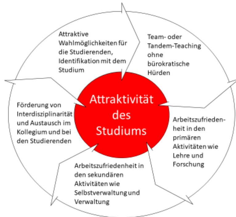
Abbildung 1: Potenziale studiengangübergreifender Lehrangebote (C. Winkelmann)

Zusammenfassend soll durch das Nutzen dieser Potenziale schließlich die Attraktivität der Studiengänge steigen (s. Abb. 1).